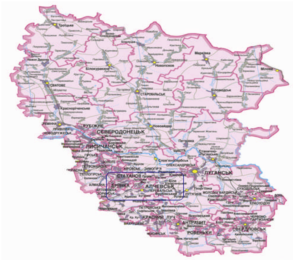
Рис. 1 Центрально-Луганський субрегіон на території Луганської області.